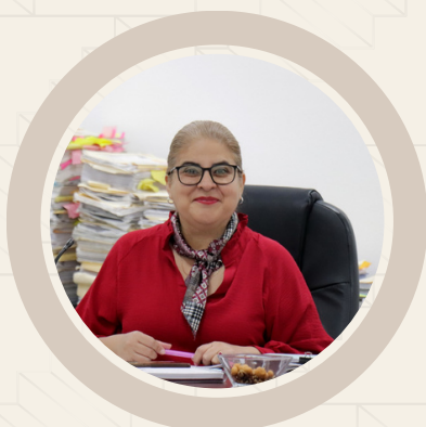
Azucena Marín Correa

Magistrada de la Quinta Sala del Tribunal en Materia Anticorrupción y Administrativa del Estado de Michoacán